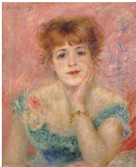
ピエール=オーギュスト・ルノワール 「ジャンヌ・サマリーの肖像」 1877年 ©The State Pushkin Museum of Fine Arts, Moscow

横浜ベイシェラトンホテル&タワーズでは、2013年7月6日(土)から9月16日(月・祝)まで、横浜美術館(西区みなとみらい)で開催される「プーシキン美術館展 フランス絵画300年」の会期にあわせ、バー「ベイ・ウエスト」よりオリジナルカクテル「ジャンヌ・サマリー」と「プーシキン美術館展 観覧券付き 宿泊プラン」を発売します。さらに、会期中に同展の観覧券をご提示いただくとロビーラウンジ「シーウインド」の「シーウインド ケーキセット」をスペシャルプライスにてご賞味いただけるなど、様々なサービスをご用意します。詳細は以下の項目をご覧ください。