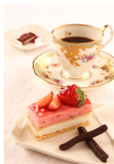
*ケーキセットのイメージ

赤道直下のインドネシア・スラウェシ島トラジャ地方で育まれるトアルコ トラジャコーヒーは、芳醇な香りと柑橘類を思わせる酸味が特徴で、かつてヨーロッパの王侯貴族に絶賛されたアラビカ種の最高峰コーヒーです。「シーウインド」ではオーダーをいただいてからハンドドリップにてご提供いたします。酸味と苦味のバランスが取れた豊かな味わいをお楽しみいただけます。