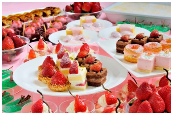
ナイトスイーツブッフェ「Sweets Parade」 ～ストロベリーフェア～ ロビーラウンジ「シーウインド」(2F) ブッフェイメージ