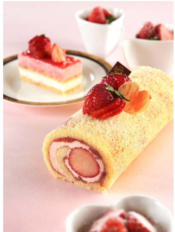
*ペストリーショップ「ドーレ」あまおうスイーツのイメージ

なお、すでに開催中の「ベイ・ビュー」および「シーウインド」では、本フェアのメニューの全てにあまおうを使用いたします。