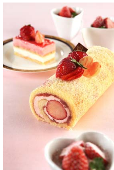
*あまおうスイーツのイメージ