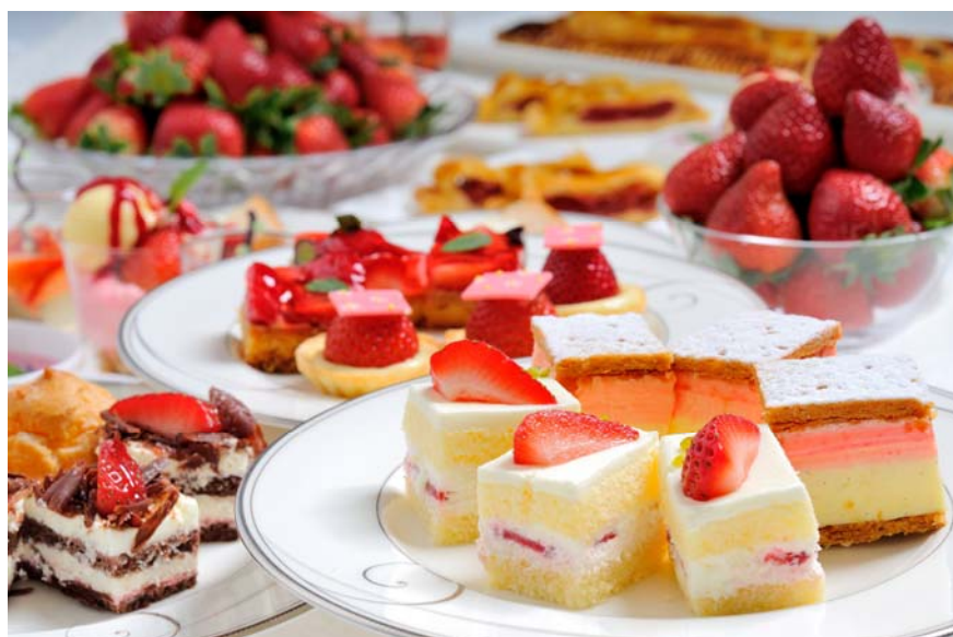
アフタヌーンスイーツbuffet ～ストロベリーフェア～ スカイラウンジ「ベイ・ビュー」（28F） buffetイメージ